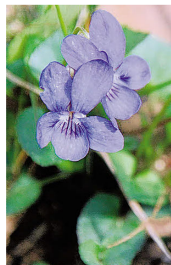
Das Hundsveilchen blüht jetzt.

Alle Versicherten der pronova BKK erhalten bei der Teilnahme an der Anti-Diät-Club-Wanderung 500 Bonuspunkte. Bitte das Bonusheft mitbringen, es wird beim Start abgestempelt.