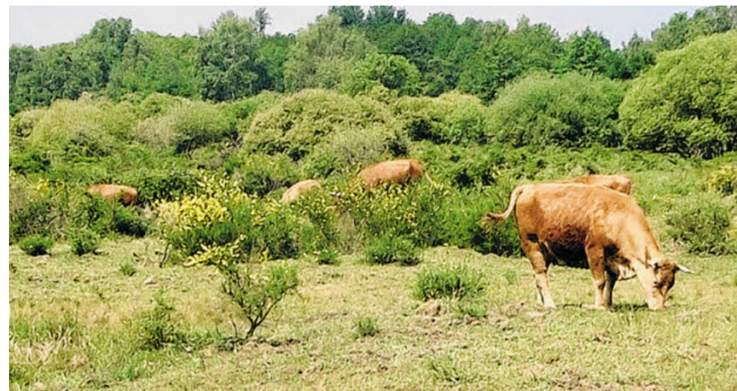
Typischer Anblick in der Wahner Heide: Glanrinder grasen im Ginster.

Wer gerne wandert und gemeinsam mit anderen durch die Natur spaziert, sollte sich den übernächsten Samstag dick im Kalender anstreichen. Am 5. Mai lädt der Anti-Diät-Club des „Kölner Stadt-Anzeiger“ zur großen Frühlingswanderung durch die Wahner Heide ein. Mit